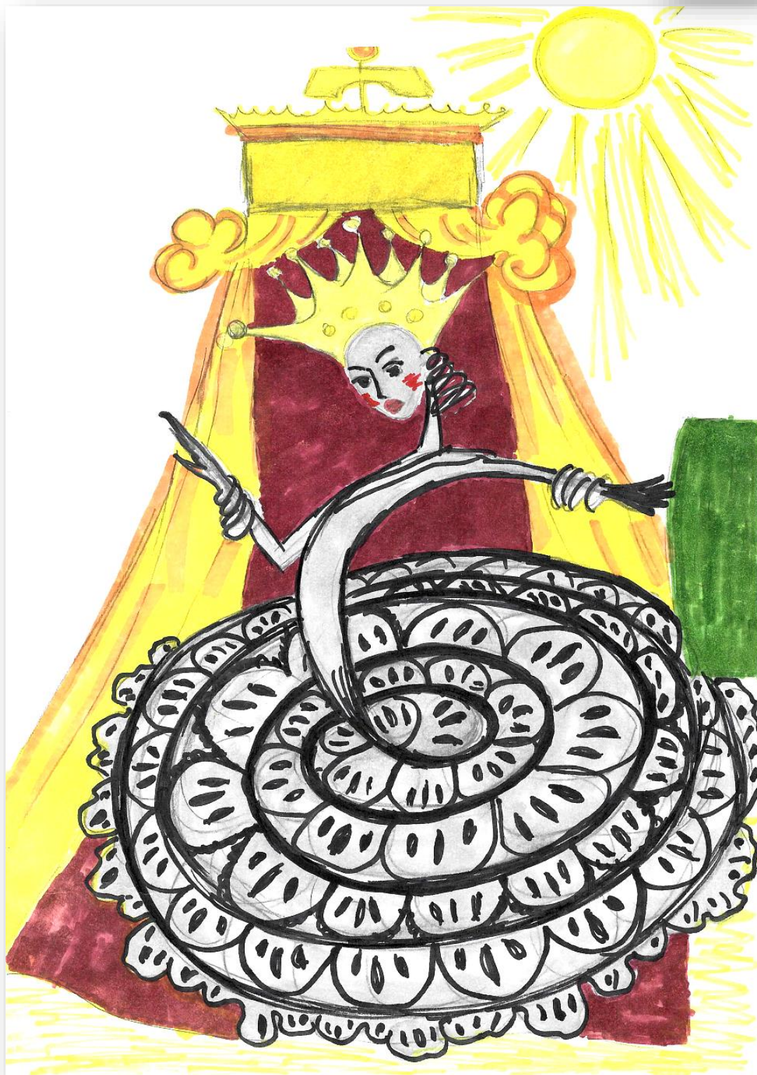
Пружина («Городок в табакерке»)