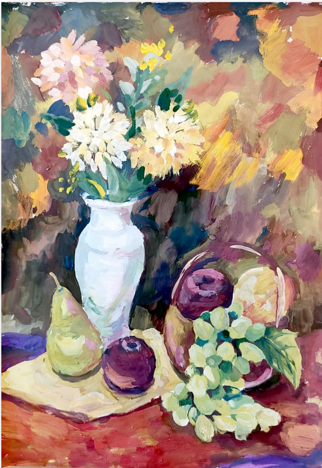
Натюрморт с цветами и фруктами