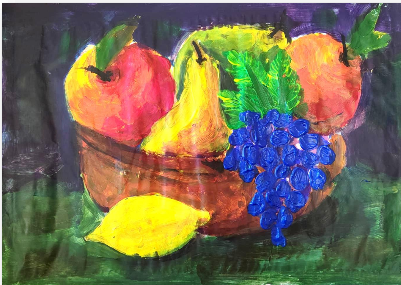
Натюрморт с фруктами