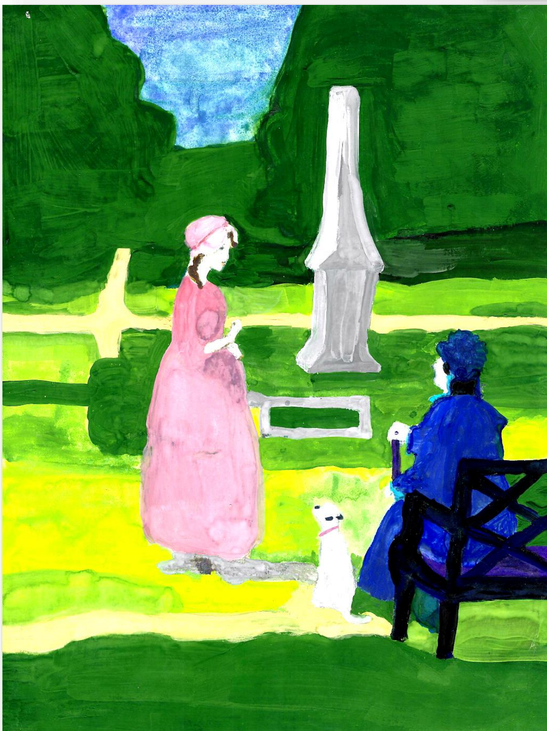
Иллюстрация к повести А.С.Пушкина «Капитанская дочка»